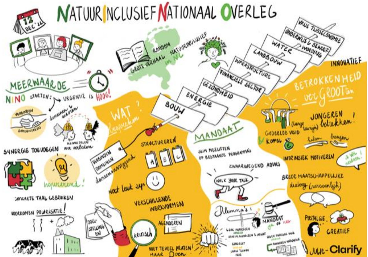
Afbeelding: Visuele weergave van de consultatiebijeenkomst voor koplopers uit de domeinen om mee te denken over de vormgeving van het NiNO.

consultatie te organiseren over de vorming en inrichting van het nieuw op te richten Natuurinclusief Nationaal Overleg (NiNO).