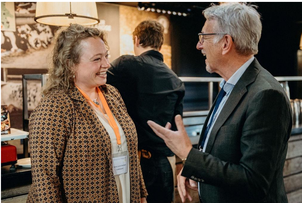
OFL Werkconferentie 2022