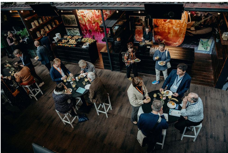
OFL werkconferentie 2022

Als nieuwe vorm van overleg en om de verbinding op een andere manier te faciliteren, maakt het OFL-secretariaat in 2023 een start met het inrichten van een (online) OFL-community. Met de community geeft het OFL leden meer ruimte voor betrokkenheid, los van OFL-projecten. In 2023 bouwt het OFL de online community uit tot een ontmoetingsplek voor alle OFL-leden. De community wordt een plek waar leden kunnen laten weten wat er voor hen toe doet in de fysieke leefomgeving, waar zij kennis kunnen delen en met elkaar in gesprek gaan.