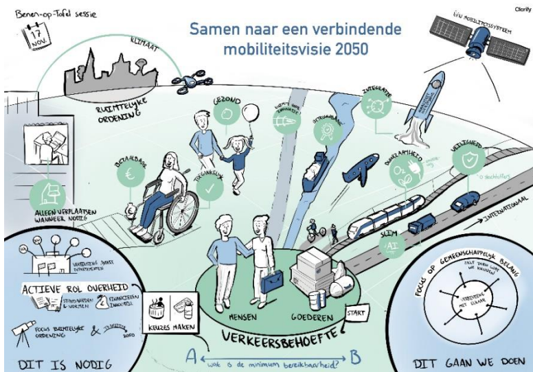
Afbeelding: Visuele notulen van de benen-op-tafel-sessie. Zichtbaar is dat deelnemers een gemeenschappelijk toekomstbeeld hebben van een schoon, veilig en gezond mobiliteitssysteem binnen de grenzen van het klimaat, waarbij sprake is van verbinding tussen mobiliteitspartijen en waarbij de overheid een actieve rol speelt.

Het doel van de OFL-consultaties is een brede groep belanghebbenden bij de totstandkoming van de Mobiliteitsvisie 2050 te betrekken. Na een strategisch debat binnen de Tweede Kamer over bereikbaarheid wordt besloten hoe dit proces, en dus ook de betrokkenheid van het OFL, verdergaat. Het OFL heeft voor het vervolg aangedrongen op een goed, breed en vooral zorgvuldig participatieproces, met duidelijkheid over welke partijen aan tafel gevraagd worden voor een goede balans van belangen. Het ontwerp van zo'n proces moet strategisch en op basis van goede analyses gedaan worden, zowel voor bedrijven en maatschappelijke organisaties als burgers.